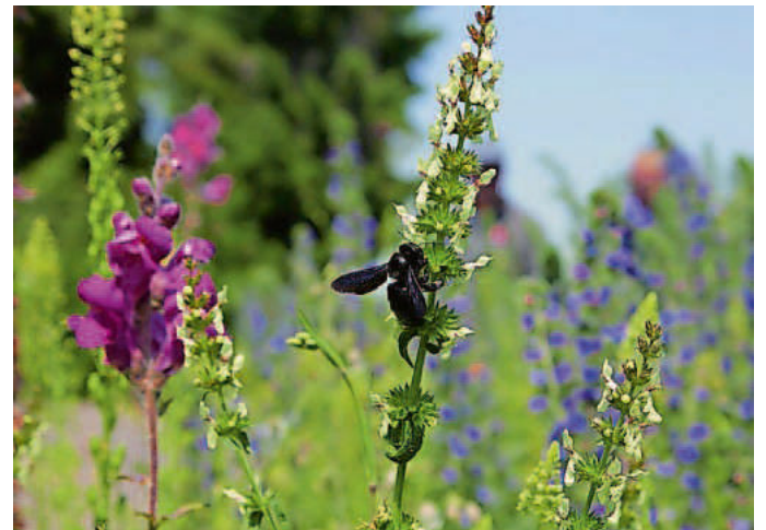
Eine Blauschwarze Holzbiene besucht eine Salbei-Blüte.

Mit der Teilnahme am NABU-Projekt „Natur nah dran“ setzt sich die Gemeinde Vörstetten für Wildbienen und andere Insekten ein. So werden derzeit Grünflächen mit Wildpflanzen umgestaltet, um ein Nahrungsangebot und Nistquartiere für die wichtigen Bestäuber zu schaffen. Das Projekt „Natur nah dran“ wird gefördert durch das Ministerium für Umwelt, Klima und Energiewirtschaft Baden-Württemberg. www.Naturnahdran.de